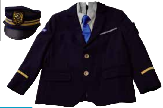
大阪モノレール 子ども制服