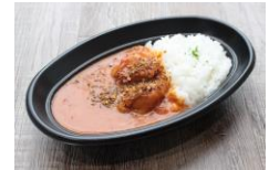
スタッフプラス 「バターチキンカレー」