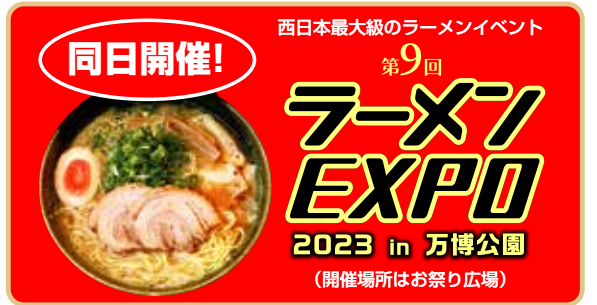
同日開催! 西日本最大級のラーメンイベント 第9回 ラーメン EXPO 2023 in 万博公園 (開催場所はお祭り広場)