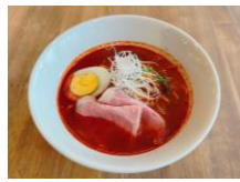
きさんじ 「泉州辛ラーメン」