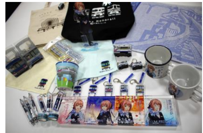
大阪モノレール オリジナルグッズ(例)