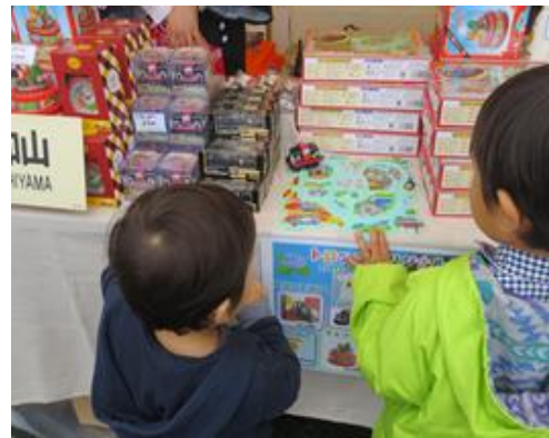
各社オリジナルグッズ販売

テーマは、“鉄道がつなぐ1970年大阪万博から2025年大阪・関西万博へ～「2025年大阪・関西万博へは鉄道で行こう！」「日本の旅は鉄道の旅」～”で、5つのゾーン(2025年大阪・関西万博/鉄道/観光/グルメ/ステージ)で様々な企画・展示を行います。