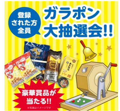
広島県観光連盟(HIT) ガラポン抽選会