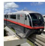
沖縄都市モノレール