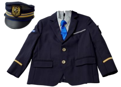
大阪モノレール 子ども制服