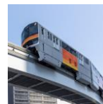
多摩都市モノレール