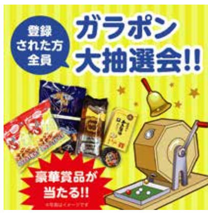
広島県観光連盟 (HIT) ガラポン抽選会

■主催：大阪モノレール株式会社、大阪府、吹田市 ■出展の鉄道会社等：道南いさりび鉄道 / 青い森鉄道 / 津軽鉄道 / IGR いわて銀河鉄道 / 仙台空港鉄道 / ひたちなか海浜鉄道 / 京成電鉄 / 新京成電鉄 / 千葉都市モノレール / 銚子電気鉄道 / 東葉高速鉄道 / 北総鉄道 / 京王電鉄 / 多摩都市モノレール / 東急電鉄 / 東京地下鉄 / 東京モノレール / 東日本旅客鉄道 / ゆりかもめ / 江ノ島電鉄 / 小田急電鉄 / 京浜急行電鉄 / 湘南モノレール / 箱根登山鉄道 / 横浜シーサイドライン / えちごトキめき鉄道 / 北越急行 / 黒部峡谷鉄道 / IR いしかわ鉄道 / 北陸鉄道 / えちぜん鉄道 / 福井鉄道 / 富山山麓電気鉄道 / アルピコ交通 / 明知鉄道 / 樽見鉄道 / 長良川鉄道 / 養老鉄道 / 静岡鉄道 / 愛知環状鉄道 / 東海旅客鉄道 / 名古屋鉄道 / 三岐鉄道 / 四日市あすなろ鉄道 / 近江鉄道 / WILLER TRAINS / 叡山電鉄 / 嵯峨野観光鉄道 / 大阪市高速電気軌道 / 大阪モノレール / 大阪モノレールサービス / 関西鉄道協会 / 北大阪急行電鉄 / 近畿日本鉄道 / 京阪電気鉄道 / スルッと KANSAI / 東北高速鉄道 / 南海電気鉄道 / 西日本旅客鉄道 / 日本貨物鉄道関西支社 / 阪堺電気軌道 / 阪急電鉄 / 阪神電気鉄道 / 神戸市交通局 / 神戸電鉄 / 山陽電気鉄道 / 能勢電鉄 / 北条鉄道 / 紀州鉄道 / 和歌山電鐵 / 智頭急行 / 若桜鉄道 / 一畑電車 / 広島高速交通 / 阿佐海岸鉄道 / 四国旅客鉄道 / 寒霞渓ロープウェイ / 高松琴平電気鉄道 / 北九州高速鉄道 / 筑豊電気鉄道 / 鳥原鉄道 / くま川鉄道 / 熊本市交通局 / 肥薩おれんじ鉄道 / 沖縄都市モノレール ■自治体等：大阪府・大阪市万博推進局 / 大阪府府民文化部 / 大阪府都市整備部 / 豊中市 / 吹田市 / 摂津市 / 鳥取県西日本本部 / 福岡県 / 広島県観光連盟 (HIT) / 広島・宮島・岩国地方観光協議会 / 徳島県物産協会大阪支部 / 沖縄県観光物産振興協会 / 北陸新幹線建設促進同盟会 / 北陸新幹線早期全線開業実現大阪協議会 / リニア中央新幹線早期全線開業実現協議会 / 台湾観光協会 ■企業等：アサカサ車輛製作所 / エビスタコーポレーション / カサロ / OJICO / 交通趣味キャラリ / サウンド / ジェイアール西日本商事 / ジェイアール西日本テイラーサービスネット / ジェイアール東日本企画 / 知照屋 / ホビーショッポモア / 松本商事 / 八千代電設工業 / ロジネクス 近畿 ■協力：関西鉄道協会 / 万博記念公園マネジメント・パートナーズ / 三井不動産商業マネジメント株式会社 / 株式会社ロップ / 株式会社 First Bridge / 鉄道少年会 ■後援：公益社団法人 2025年日本国際博覧会協会 (予定)